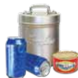
IMBALLAGGI IN ALLUMINIO E ACCIAIO