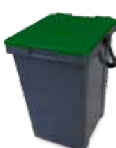
Mastello Verde Vetro