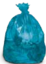
Sacchi Blu Plastica e metalli

La raccolta differenziata prevede l'assegnazione di contenitori per la raccolta differenziata ad uso esclusivo di ogni famiglia o condominio (sopra 4 unità).