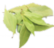
SFALCI E POTATURE