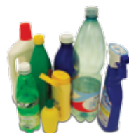
IMBALLAGGI IN PLASTICA