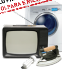
RAEE (Tutti i materiali elettrici ed elettronici)