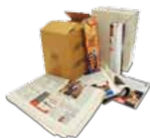
CARTA E CARTONE