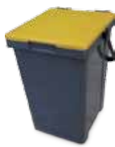
Mastello Giallo Carta e cartone