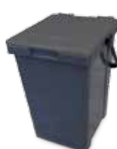
Mastello Grigio Secco Residuo