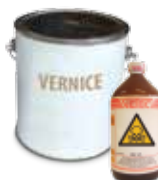
VERNICI, INCHIOSTRI ACIDI E PESTICIDI