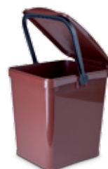
Mastello Marrone Rifiuti Organici