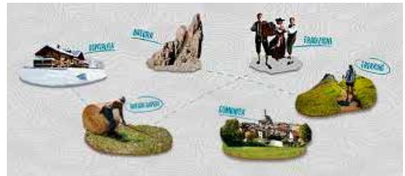
Manifesto che evidenzia l'organigramma del progetto

stival del Turismo Responsabile e conoscere progetti innovativi che basano la loro attività sul potenziale della Montagna.