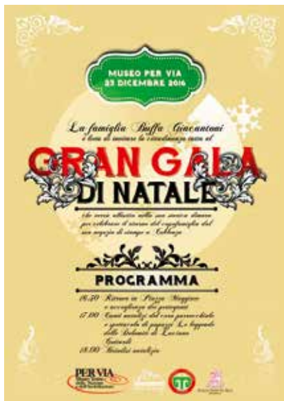
La riproduzione del manifesto originale dell'evento

storica dimora grazie alla Compagnia Teatrale San Giorgio di Castello Tesino . La famiglia ha preparato una gran festa per il ritorno a Pieve Tesino dell'uomo di casa, lontano ormai da molti anni per curare gli affari della fiorente bottega di cartoleria e stampe nella città di Coblenza. La moglie, con i figli e gli amici, ha indetto per questo atteso ritorno un allegro Gran Galà