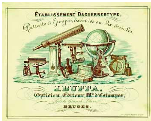
Biglietto da visita del negozio M. Buffa di Bruges