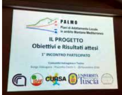
La locandina dell'evento

nità di Valle una strategia di mitigazione degli impatti del cambiamento climatico, corredata da un piano di azioni da presentare e condividere con la popolazione. Oltre alla Comunità di Valle partecipano al progetto di ricerca altri ambiti montani italiani per rappresentare sia l'ambiente alpino che appenninico.