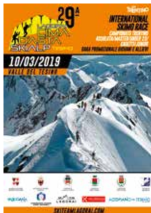
Locandina della 29° Lagorai Cima d'Asta Skialp Tesino

Come ogni anno, la presenza sul tracciato di molti Volontari e Soccorritori preparati e una buona organizzazione, ha dato alla manifestazione un risultato eccezionale e una costante crescita.