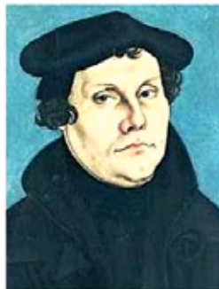
Un'immagine di Martin Lutero

Due appuntamenti a Strigno per entrare nella “battaglia mediatica”