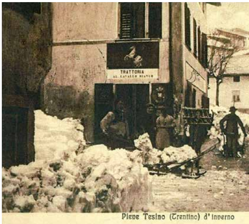
Piave Tesino (Trentino) d'Inverno