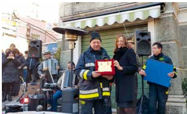
Nelle due foto i momenti significativi della consegna delle targhe