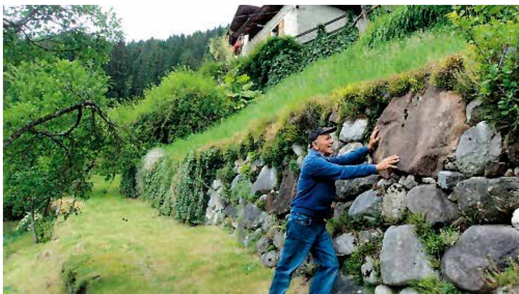
Foto di un muro a secco con massi ciclopici al Maso Vendelin