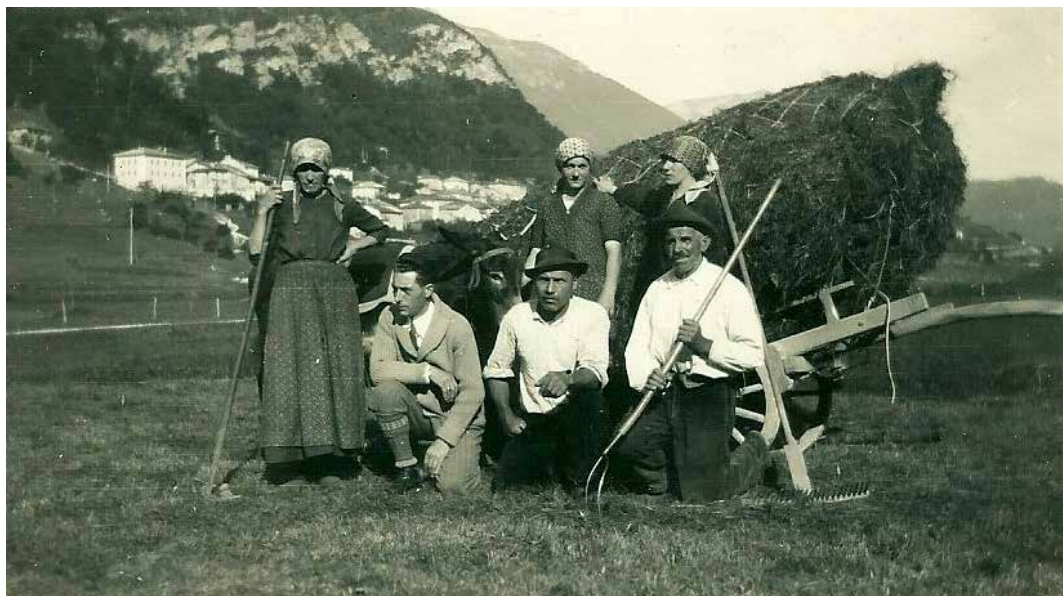
Nella bella foto in bianco - nero, sui prati del Coldan , possiamo vedere “ la re ”, collocata sul carro da ben tre donne e tre uomini