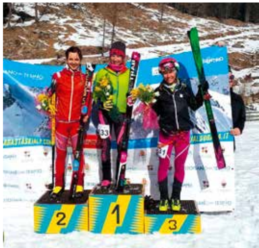
Il podio delle ragazze

Nonostante la scarsità di neve e un inverno pressoché assente anche quest'anno, siamo riusciti a portare a termine la nostra prestigiosa Gara di scialpinismo Lagorai Cima d'Asta con un percorso d'eccezione a dir poco strepitoso.