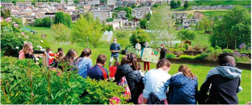
Un momento della giornata iniziale di pionieri tenutasi presso il Giardino d'Europa Alcide De Gasperi.

“Pionieri”, il percorso di crescita e formazione rivolto ai bambini e alle bambine della scuola primaria lanciato nel 2020 dalla Fondazione Trentina Alcide De Gasperi.