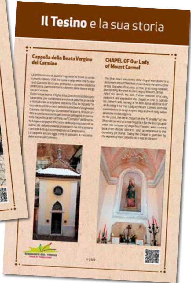
Schede evidenziate al n. 1 e al n. 2 della planimetria.