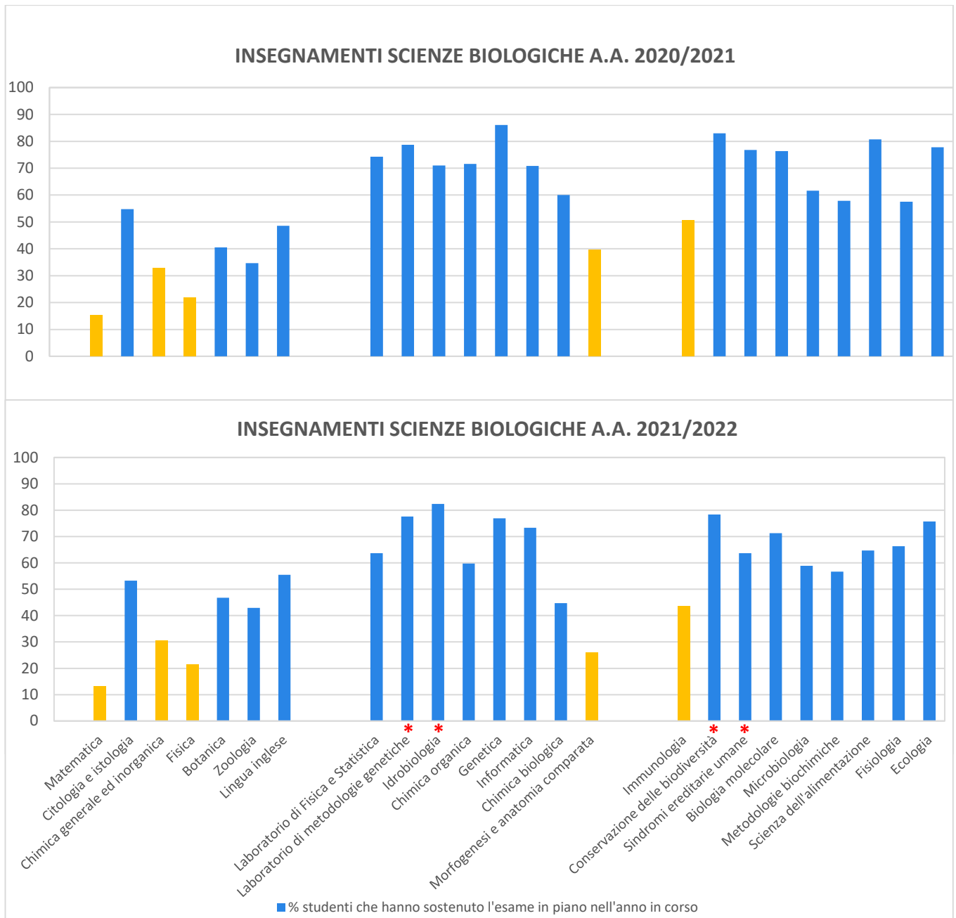
Figura 1. Monitoraggio degli esami sostenuti dagli studenti di Sc. Biologiche. * AFS, Attività Formativa a Scelta. In giallo gli insegnamenti attenzionati.